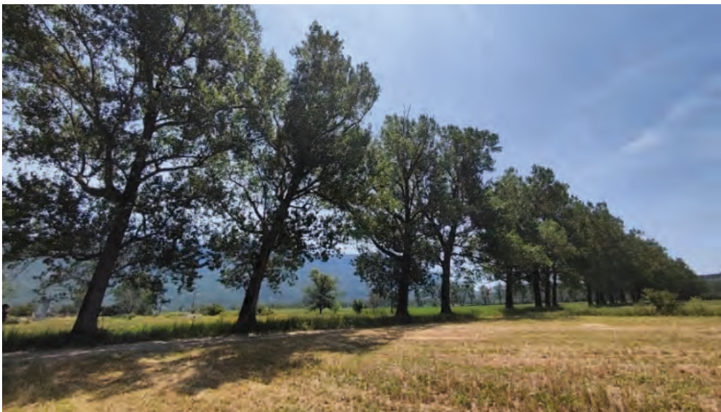
Slika 11. Vjetrozaštitni pojasevi Čepić polja

Čepić polje se nalazi u podnožju planine Učka, uz naselje Polje Čepić u općini Kršan. Nastalo je 1932. godine isušivanjem Kožljačkog jezera. Meliorativni dio koji se iskorištava u poljoprivredi iznosi oko 1.800 ha, a pretvoreno je u obradivo polje izgradnjom sustava drenažnih kanala. Radi vrlo izražene erozije tla vjetrom, 1934. godine krenulo se u sadnju euroameričkih topola ( Populus x canadensis Moench). Većina topola zasađena je 1950-tih godina. Budući da topola najbolju vjetrozaštitu pruža kada se uzgaja u ophodnji od 25-30 godina, a njihova prosječna starost danas iznosi preko 60 godina, vidljivo je kako je iznimno oslabljena njihova fiziološka moć. Većina topola je u vrlo lošem stanju i potrebna je njihova zamjena. Procjenjuje se da je potrebno zasaditi oko 2000 novih sadnica drveća. Isto tako, smatra se da ova vrsta nije najbolji odabir za ovu lokaciju jer nakon što joj otpadne lišće, u zimskom razdoblju više ne pruža adekvatnu zaštitu od vjetra.