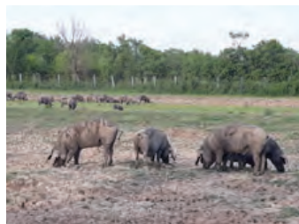
Slika 3. Silvopastoralno AŠ