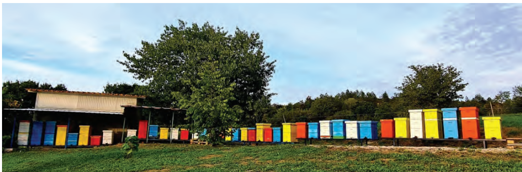
Slika 14. Košnice Lorene Šestan kraj Cerovlja u Istri

prvenstveno za med kestena i lipe. Lokacije za ispašu su najčešće unajmljene od privatnih šumoposjednika, a nekad koriste i lokacije u vlasništvu Hrvatskih šuma. U više navrata su za svoj med dobili zlatne medalje. Lorena Šestan osnivanjem svog OPG-a u Gologorici kraj Cerovlja nastavlja obiteljsku tradiciju pčelarenja.