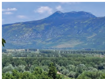
Slika 1. Vjetrozaštitni pojas

Šumsko poljodjelstvo (forest farming) podrazumijeva podizanje šumskih nasada u svrhu uzgoja kulinarskog i ljekovitog bilja.