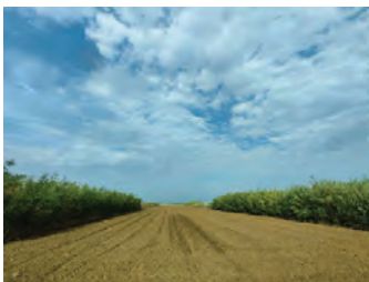
Slika 2. Silvoarabilno AŠ