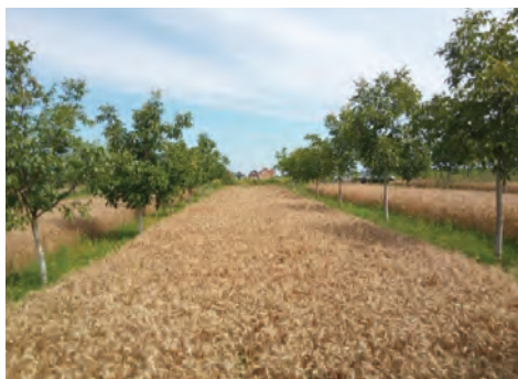
Slika 10. Konsocijacija pšenice i oraha