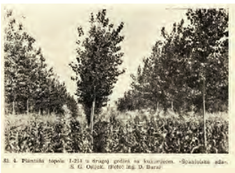
Slika 9. Plantacija topola 1-214 u drugoj godini na kukuruznom. "Šumarski sadak", S. 43. Obitelj:

Istočni dio Hrvatske, često nazivan žitnicom Hrvatske, stoljećima je pretvaran iz šumskog u poljoprivredno zemljište. Drveće, uključujući živice, uklonjeno je ostavljajući krajolik beskrajnih poljoprivrednih polja. Šumarski institut je 60-ih godina ispitivao mogućnost usijavanja ratarskih kultura u mlade sastojine topole. Ova ispitivanja su pokazala da je isplativost usijavanja u redove plantaža topola najbolja prvih nekoliko godina, tj. nakon četvrte godine prinosi usjeva opadaju zbog utjecaja sjene, ali i zbog izostanka mineralne gnojidbe (Bura, 1962) (Slika 9). Danas se takva sjetva između drveća može naći samo prilikom podizanja trajnih nasada oraha (slika 10). Voćnjak oraha može imati i do 12m razmak između redova što omogućuje duži period međurednog usijavanja ratarskih kultura. Novi zakon o kulturama kratke ophodnje (KKO) omogućuje i podizanje redova KKO u širim razmacima te usijavanje između redova (slika 2).