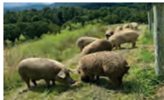
Slika 4-6. Silvopastoralni uzgoj banijske šare, crne slavonske svinje i mangulice

Cilj silvopastoralnog sustava je omogućavanje životinjama da se prehrane u slobodnim uvjetima držanja, ali bez degradacije šumskih i pašnih površina. Stoga je broj životinja po jedinici površine ograničen, ovisno o stanju i stadiju šume ili pašnjaka.