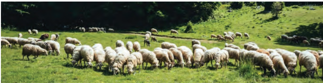
Slika 8. Ovce na ispaši u Parku Prirode Učka

Obitelj Maliki bavi se proizvodnjom ovčjeg sira u selu Pilati na Maloj Učki već pola stoljeća. Njihovih 600 ovaca može se vidjeti u slobodnoj ispaši na učkarskim šumama i pašnjacima tijekom sezone, a zimi borave u Istri, kraj Vodnjana. Radi se o 68 ha šumskog zemljišta kojeg imaju u zakupu od Hrvatskih šuma d.o.o. Njihov učkarski sir ima certifikat o ekološkoj proizvodnji.