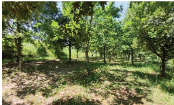
Slika 12. i 13. Plantaža tartufa Karlić