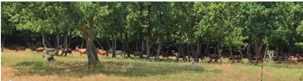
Slika 7. Koze na farmi Kumparička

Na farmi Kumparička uzgajaju se koze s ciljem proizvodnje kozjeg sira. Tristotinjak koza je u slobodnoj ispaši u šumi na površini od oko 200 ha. Dio šumskog zemljišta, oko 160 ha, vlasnici poljoprivrednog gospodarstva imaju u zakupu od Hrvatskih šuma d.o.o. s ciljem pašarenja stoke, a ostalo je u njihovom vlasništvu. Radi se o vrlo nepristupačnim terenima, uglavnom hrastovih šuma i šikara, idealnim za razvoj kozarstva. Koze dnevno daju i do 500 litara mlijeka, a pažljivom preradom rezultat je svjetski priznat i nagrađivan ekološki sir.